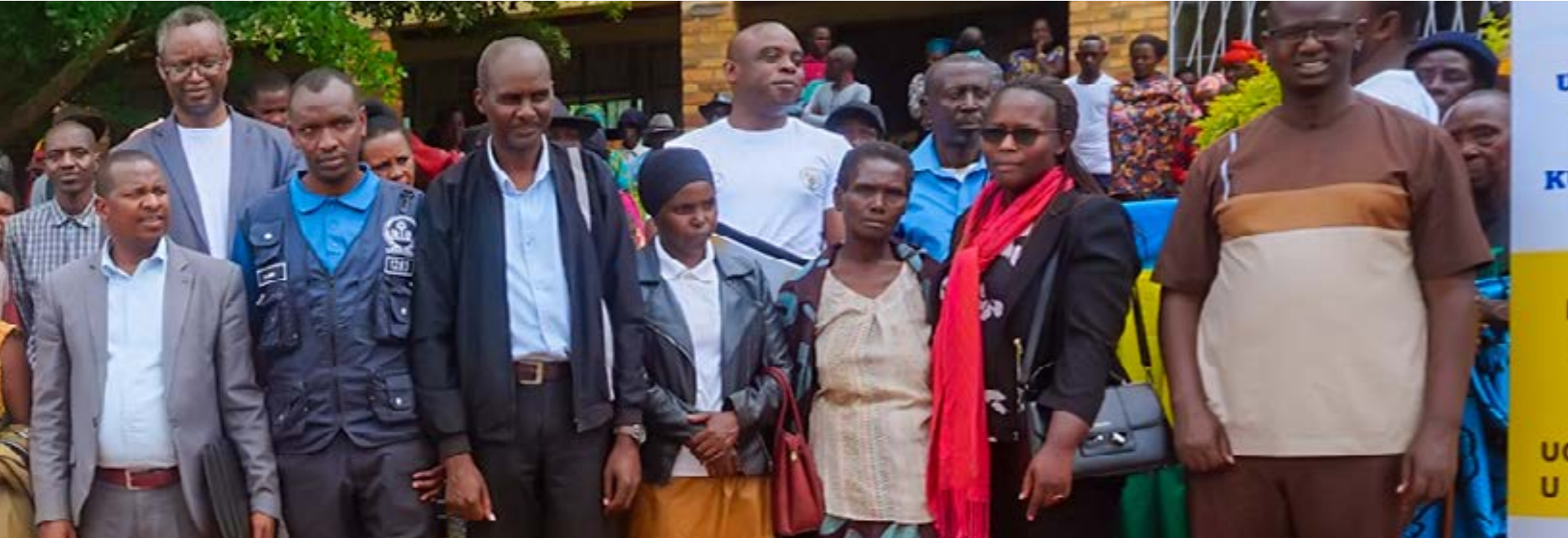
Les autorités locales mobilisaient la population pour la campagne dans les districts (Photo prise lors de la campagne à Kayonza)