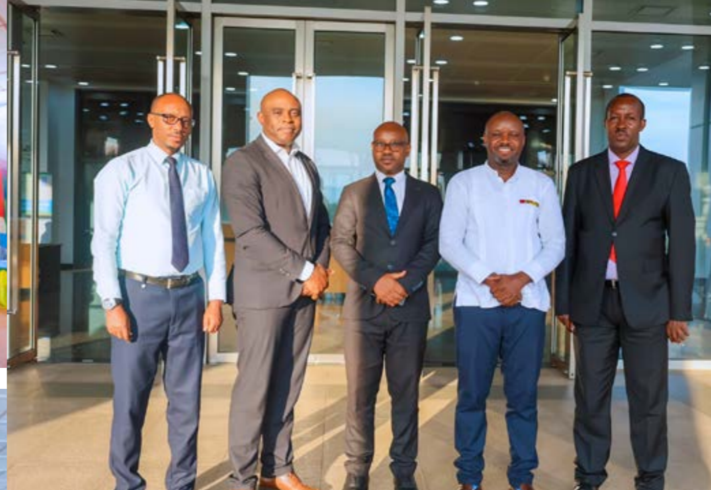
Photo de la visite d'échange avec les Secrétaire Permanent du MINIJUST sur l'action de la campagne nationale