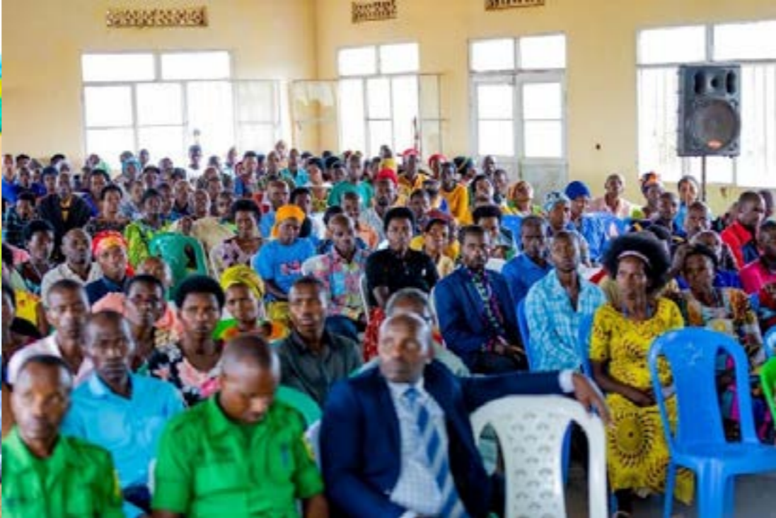
Dans les différents districts les autorités (Photo à gauche prise à Kayonza) et la populations (Photo à droite prise à Gicumbi) ont participé dans la campagne