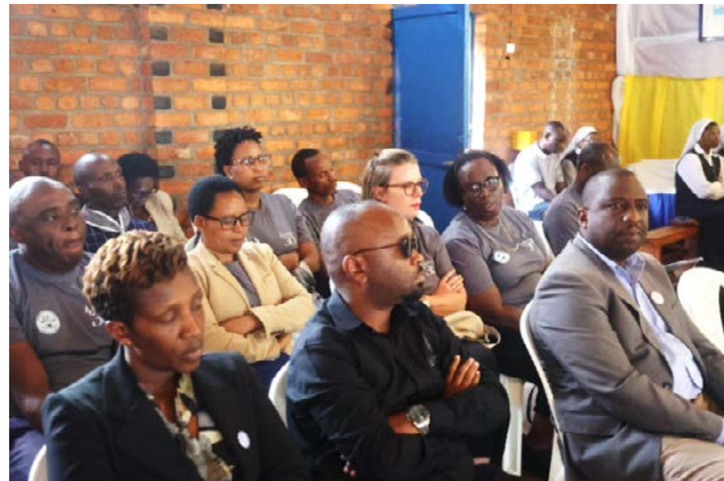
Photo : Lors de la commémoration du génocide contre les Tutsi (A Kirehe)