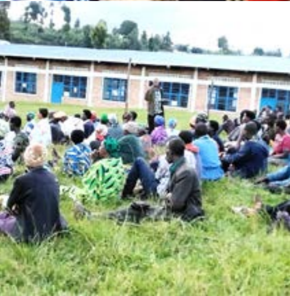
Les para juristes donnent des messages de la campagne dans les différentes rencontres communautaires : A Biryogo-Nyarugenge (Photo à gauche) et Muganza-Nyamagabe (Photo à droite)