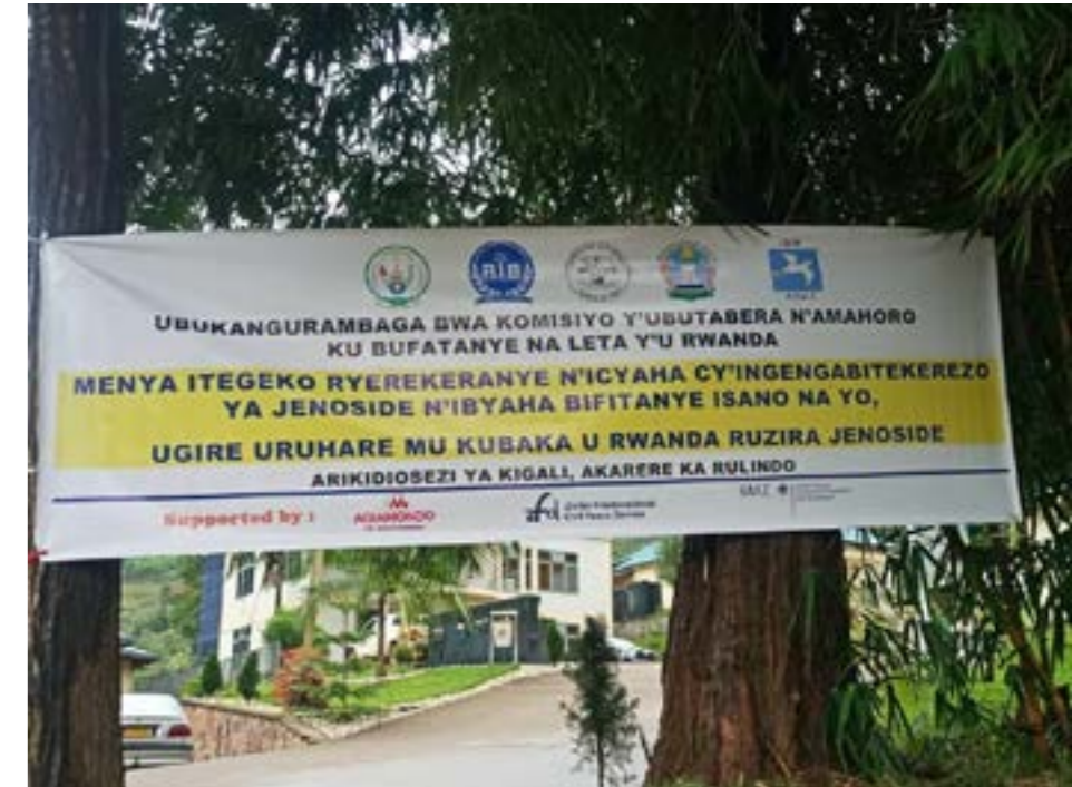
Aux bureaux de la CEJP, des CDPs et tous les districts il était affiché des banderoles pour la campagne nationale pour la prévention et lutte contre l'idéologie du génocide.