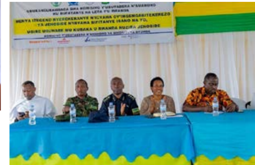
Les différentes autorités locales ont participé dans la campagne