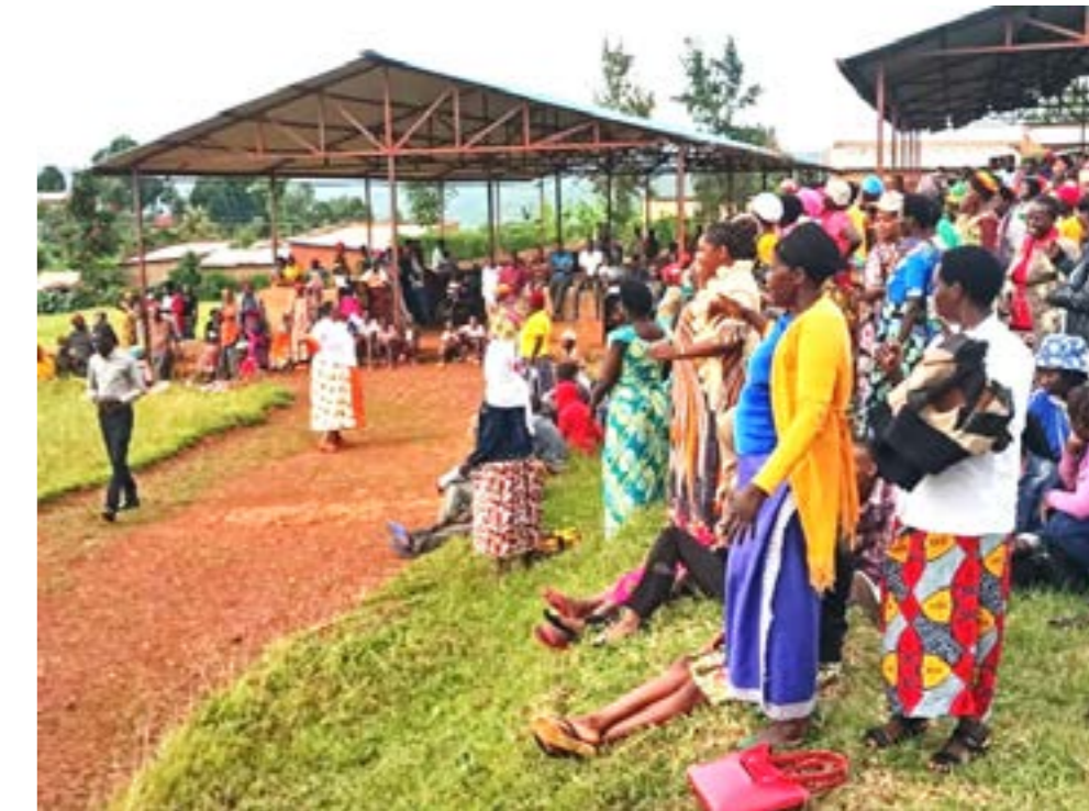
Photos prises lors de la campagne du 26/03/2024 dans le district Gasabo (Le Secrétaire exécutif du secteur Rutunga lors de l'ouverture des échanges).