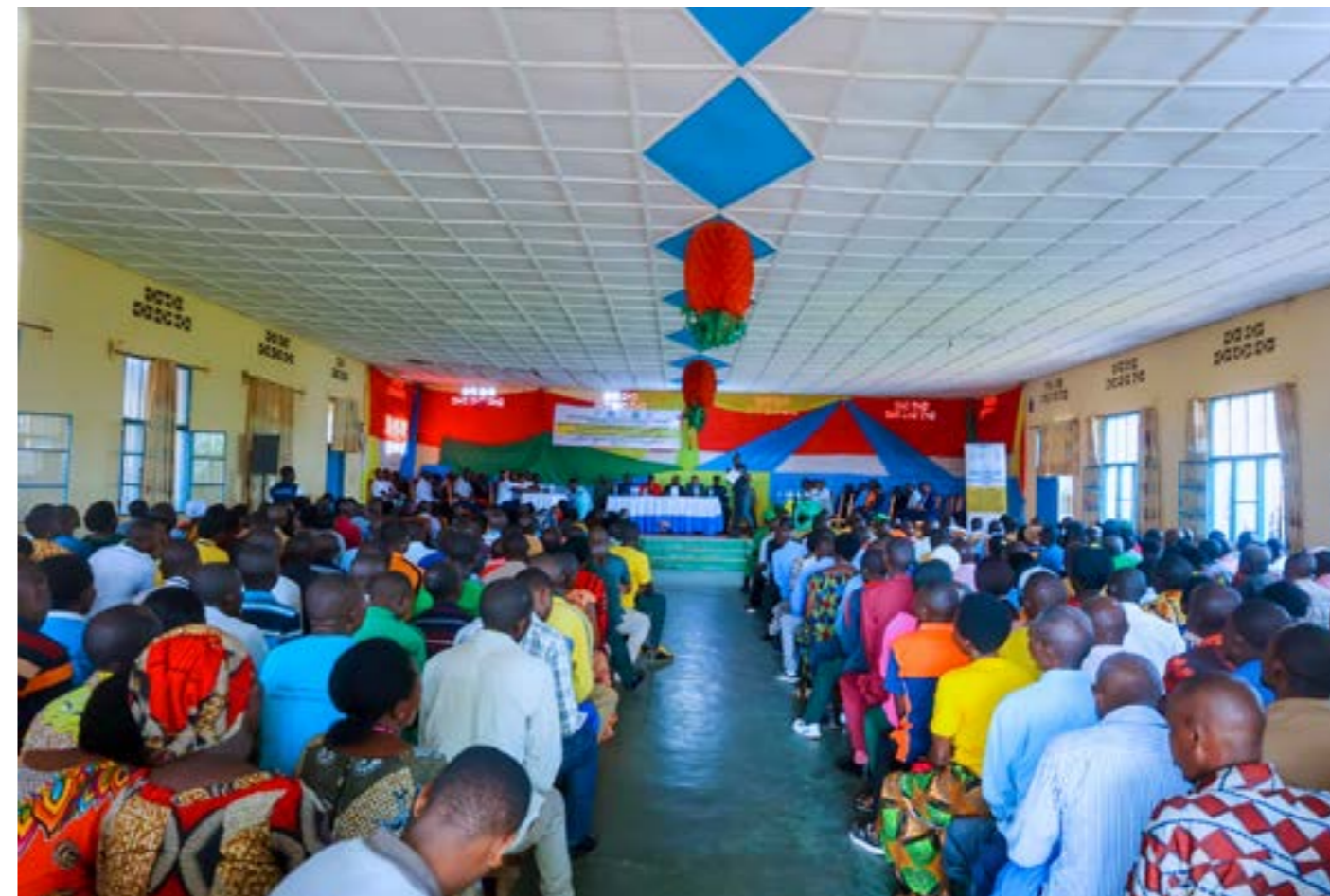
Dans les districts il y avait des foules de la population de différentes catégories et donnaient des objections et appréciation sur la vulgarisation de la loi