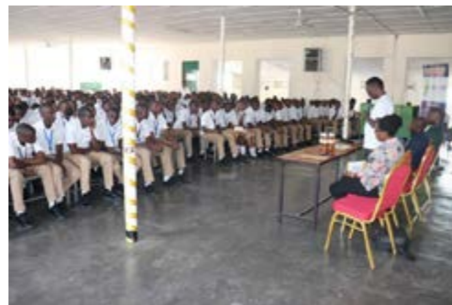
Sensibilisation au GS St Joseph de Kabgayi