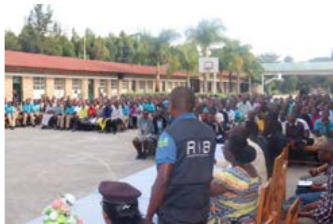
Sensibilisation à l'Ecole des Sciences de Byimana