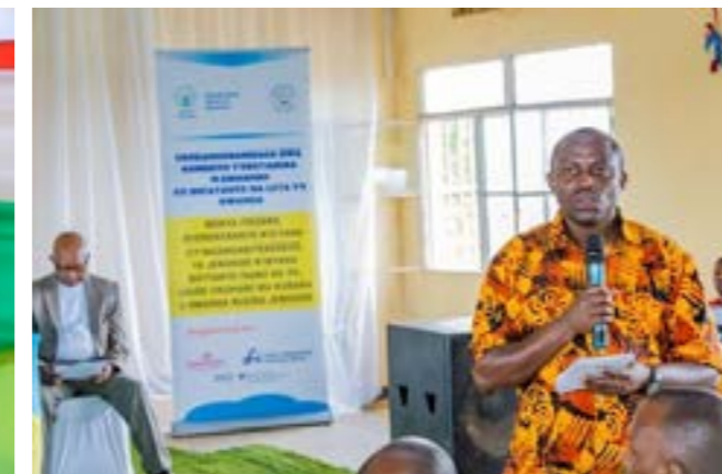
Les autorités administratives des districts étaient actives dans cette campagne De gauche à droite : le Maire du district Kayanza (Province de l'Est), Vice Maire du district de Rusizi (province de l'Ouest) et Vice Maire du district Gicumbi (province du Nord)