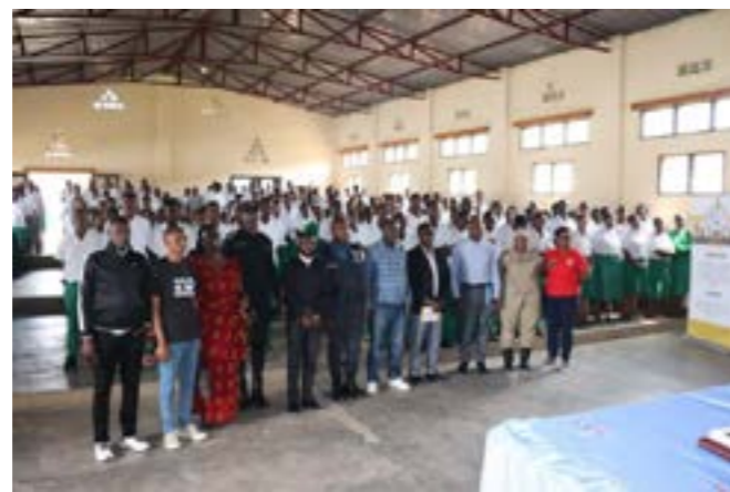
Sensibilisation au GS Ste Marie Reine Kabgayi