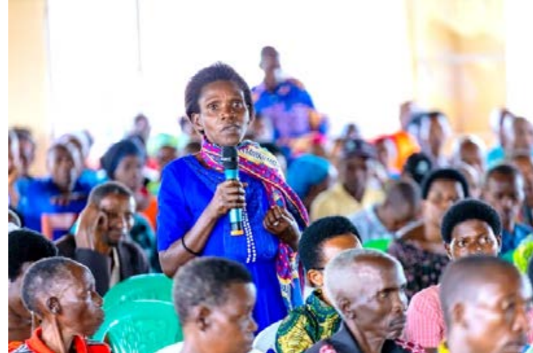
La population apprécie la vulgarisation de la loi et sollicite la fréquence de séances de cette loi et des autres lois de base en général au niveau des cellules et des villages.