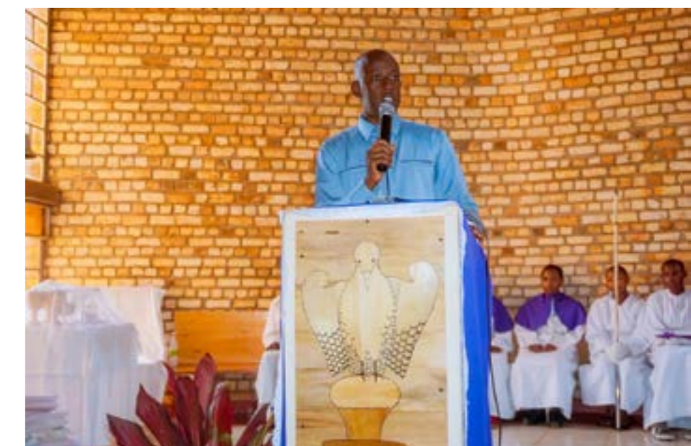
Les différentes personnes représentants de RIB, MAJ, NPPA, Armée et Police Nationale se complétaient pour expliquer la loi avec des cas pratiques et des exemples des crimes déjà commis,