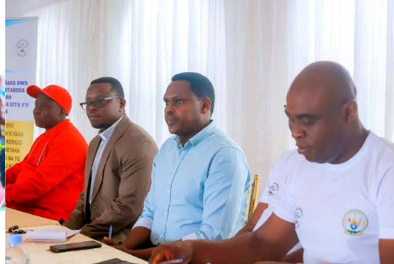
Le DEA du district de Nyarugenge au milieu, lors de la campagne dans le secteur Kigali