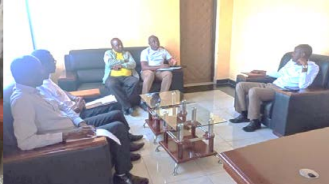
La Commission justice et paix s'entretenait avec les autorités au niveau des districts pour expliquer les objectifs de la campagne et le besoin de synergie des structures